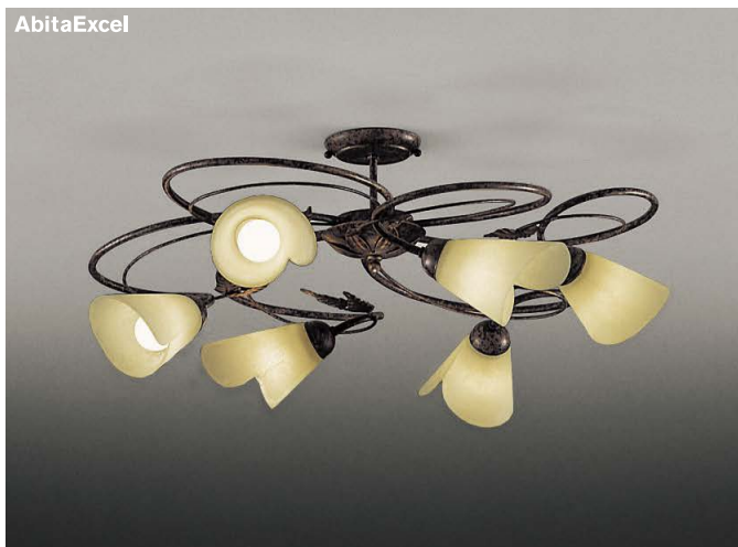
AbitaExcel XRG4021X ¥165,000

LEDランプ×6 \square <100V> フロストクリプトン球40W形×6相当 消費電力：30.0W