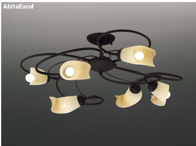
AbitaExcel XRG4020U ¥145,000

eco 省エネ | ハンドメイド | LEDランプ:RAD-427L(E17) | 電球色(2700K) | Ra80